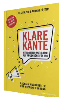
KLARE KANTE (08_2019)