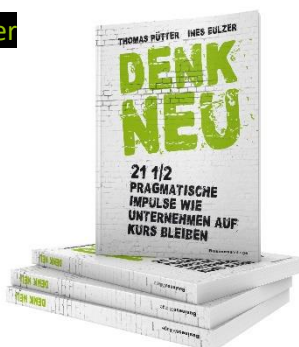
DENK NEU (2017)