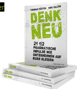
DENK NEU (2017) Mehr Infos...