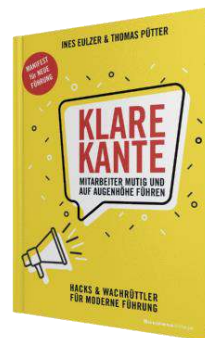
KLARE KANTE (08_2019) Mehr Infos...